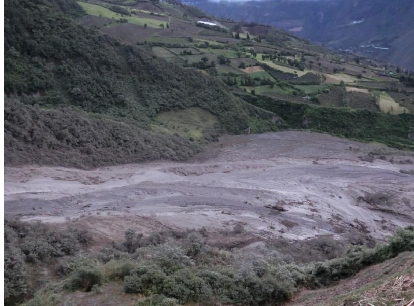
Depósito del flujo piroclástico en la zona de Juive Grande. Foto: P. Mothes. IG-EPN, Foto tomada 14 de Julio, 2013, 16H45TL.