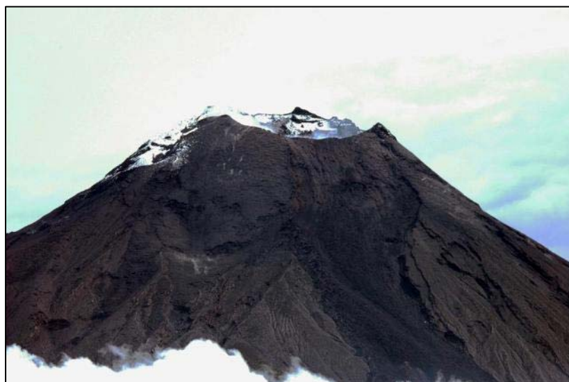
FOTO 2.- Actividad fumarólica en el borde Nor-oriental del cráter y emisión muy leve únicamente de vapor. También un pequeño penacho de hielo/nieve en borde interior de la pared Sur del cráter.